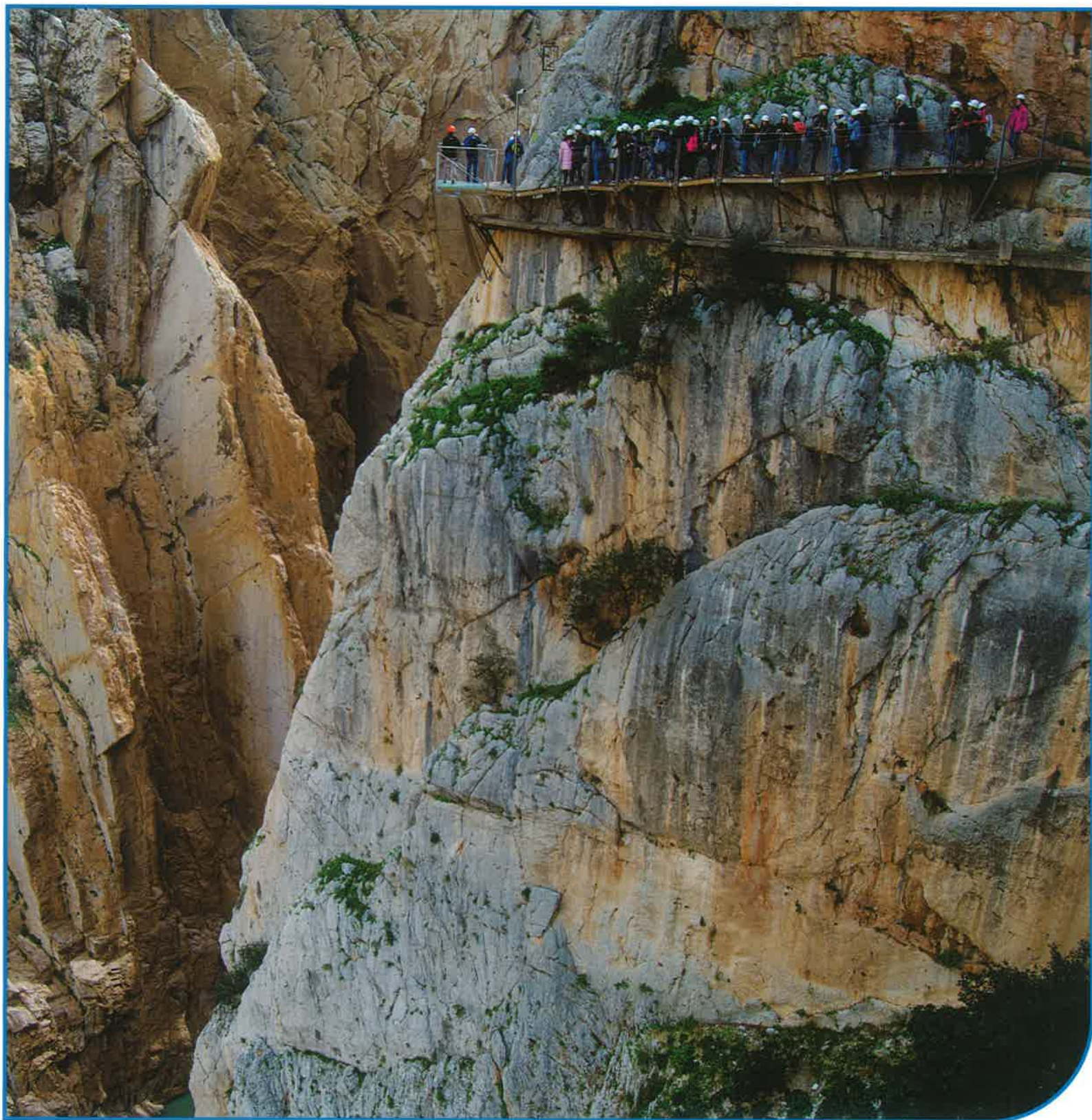
Foto: La ruta "El Caminito Del Rey" (Málaga). Incentivo organizado por Exploramos