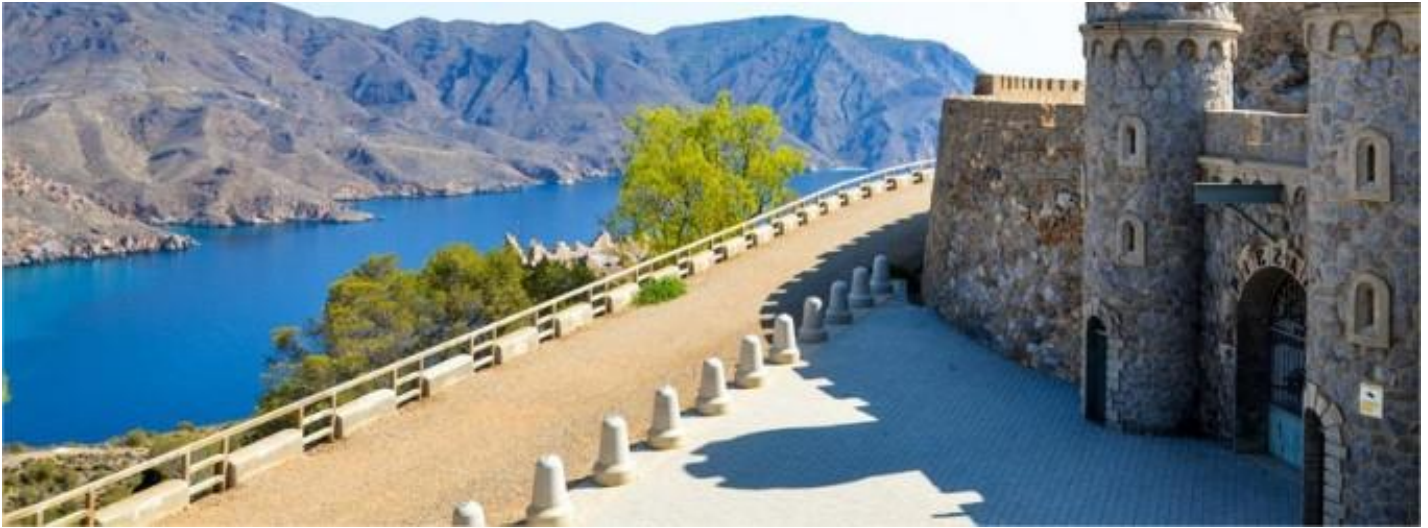
Bateria de Castillitos

El GR 92 recorre una línea costera que desde la Edad Media y hasta el s. XIX fue un terrible objeto de deseo de piratas y conquistadores.