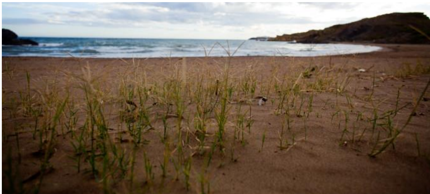
Puntas de Calnegre (Lorca).

De Norte a Sur, así se distribuye el kilometraje del GR 92 en cada municipio de La Región de Murcia: