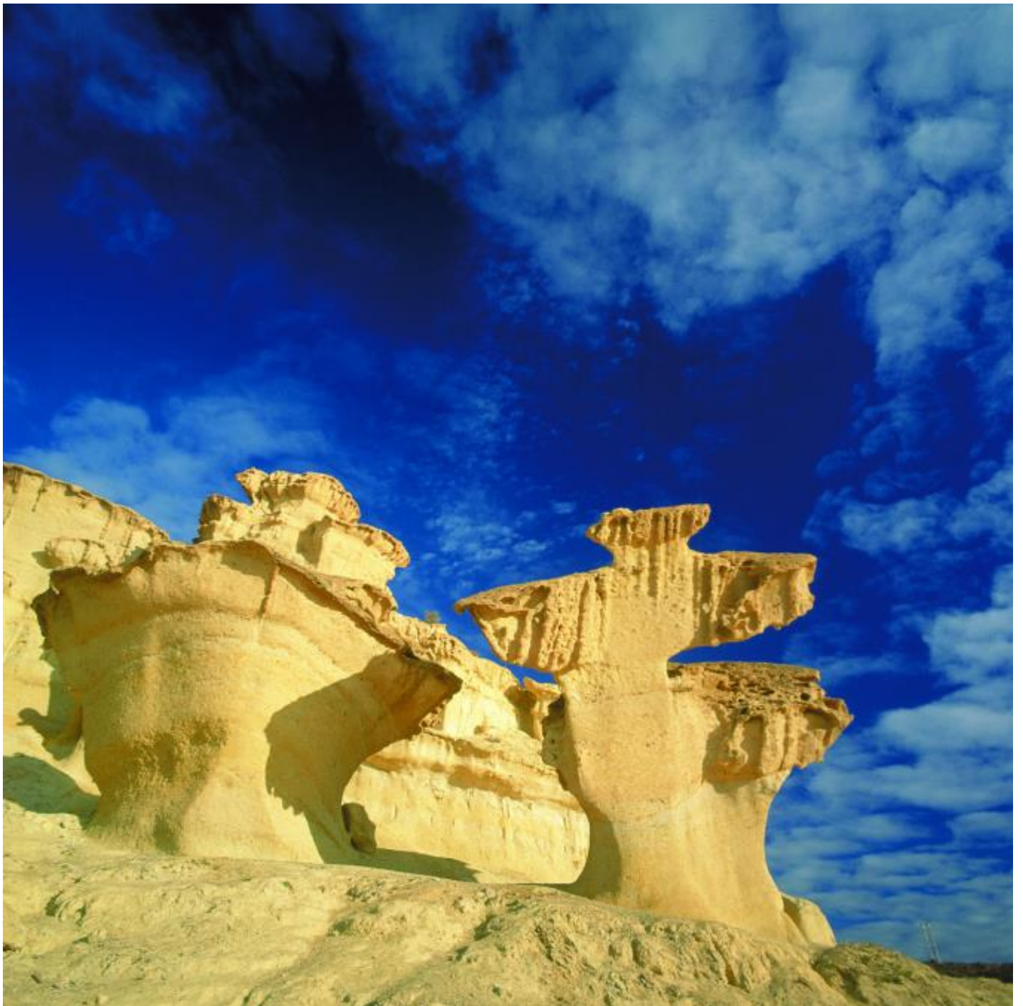
Ciudad Encantada de Bolnuevo (Murcia).