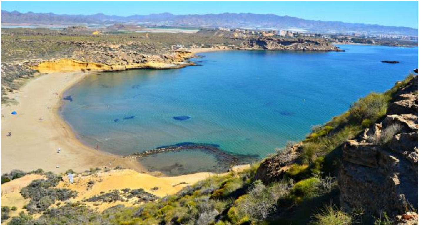
Playa de La Carolina (Águilas).